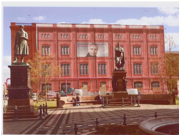
Bauakemiesimulation am Schinkelplatz – April 2016 – an Stelle des vom Tagesspiegel veröffentlichten Fotos

Drei ausgiebige Diskussionsforen hatte es im vergangenen Jahr gegeben, um Struktur, Inhalt und bauliche Gestalt der Bauakademie zu klären. Das war erforderlich, denn die Bewilligung von 62 Millionen Euro für den Wiederaufbau der Schinkelschen Bauakademie durch den Haushaltsausschuss des Bundestages Ende 2016 war überraschend gekommen. Mit einem Mal wollten und sollten alle, die irgendwie mit Architektur zu tun haben, mitreden und mitgestalten.