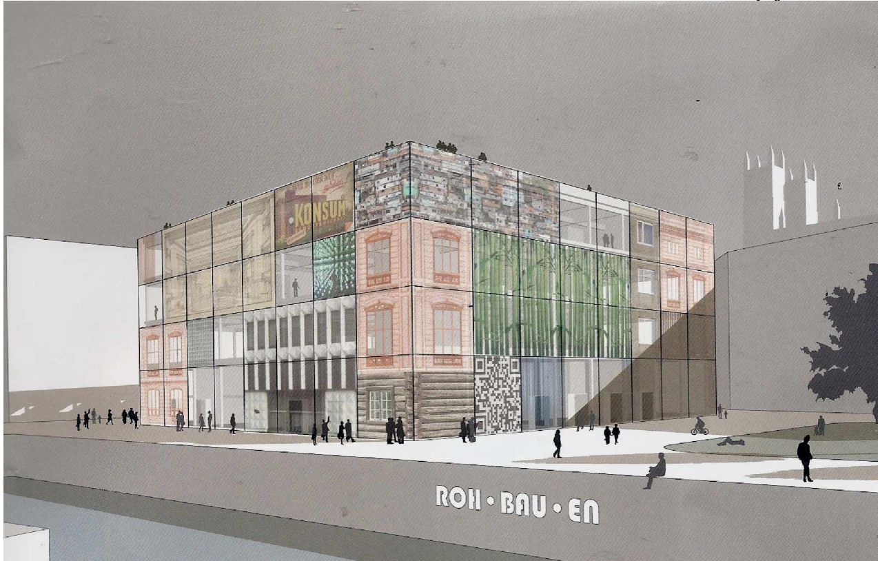
Dreher – Architekt (zum Artikel im Tagesspiegel (siehe Seite 5)