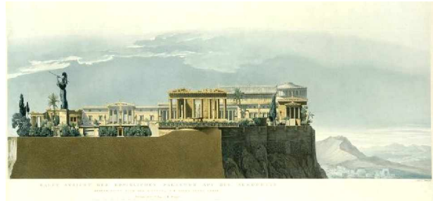
Lithographie; 40,0 x 65,4 cm B 1852 Staatliche Museen zu Berlin, Kupferstichkabinett

Pläne für einen neuen Palast auf der Akropolis ( http://schinkel.smb.museum/image_zeit.php?id=65 )